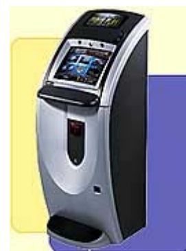
Photoplay-Konsole: Quizgames, Knobel-, Karten- und Geschicklichkeitsspiele im proprietären Netzwerk